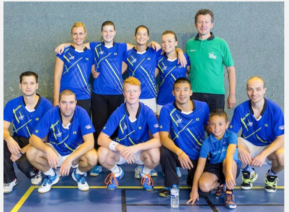
ÉQUIPE 2 - RÉGIONALE 1