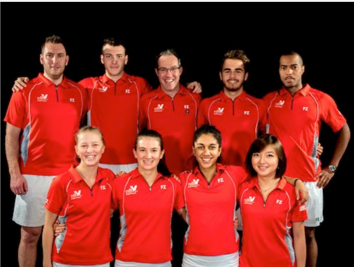
ÉQUIPE 1 - NATIONALE 1